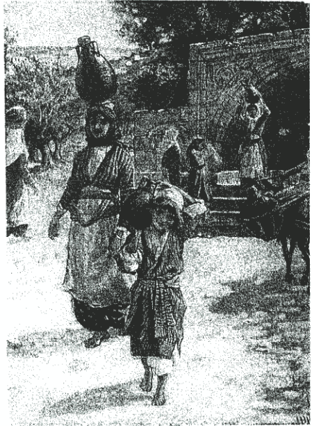
"Aln Miriam", o Fuente de María. Es uno de los sitios de cuya autenticidad no parece posible dudar, pues es la única fuente pública que había en Nazaret. A ella írían, pues, diariamente la Virgen y el Niño a proveerse de agua para el uso doméstico.

En Nazaret Cristo no dio pruebas de su Divinidad. Durante los años de su vida oculta, María mantuvo una fe heroica en el mesianismo de su Hijo.